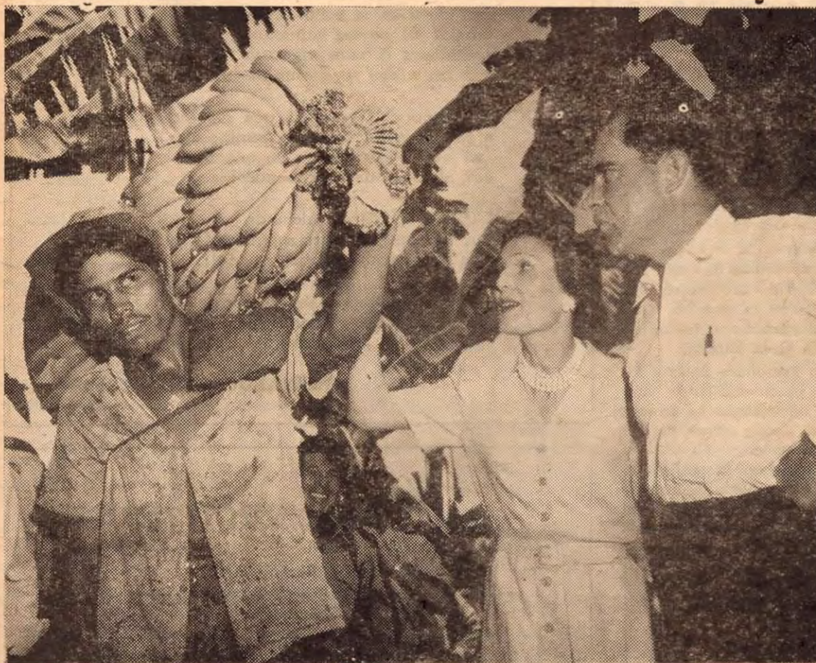
El Señor Vice Presidente de los Estados Unidos y su distinguida esposa conversan con un cargador de bananos en el Muelle de Golfito.