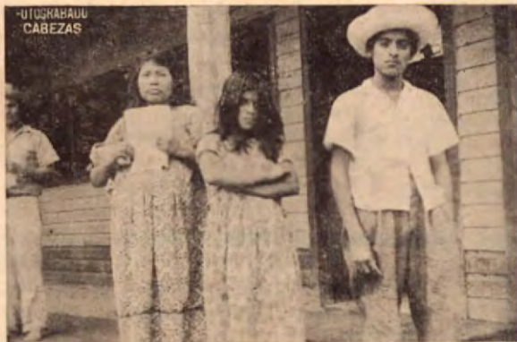
Indios Boricás de visita en Villa Neily, Golfito.

fácilmente podrá elevarse sobre sus cimientos de hoy inestables, esto sin dar por seguro que el día menos pen- sado le faltará la sabia económica que la Bananera le da hoy.