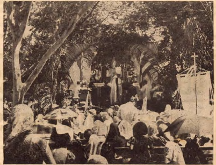
Después del recibimiento vino la primera misa de Monseñor, la cual se celebró en el Potrero de las Guayabas, donde se le improvisó un altar antes de entrar al Pueblo.