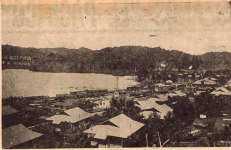
Una vista del Caserío afincado en la zona portuaria de Golfito.