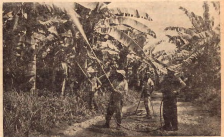
El riego del caldo bordelés es un trabajo permanente en las plan- taciones bananeras. Aquí vemos a un grupo de trabajadores efectuando su trabajo.

Aunque la región es húmeda, dado la gran cantidad de lluvias y de ríos, la Compañía mantiene una constante irrigación de las matas en la época del calor. Los bananales necesitan mucha agua para producir y conservarse. Por medio de este sistema de mangueras de presión, se riegan los más alejados rincones del bananal.