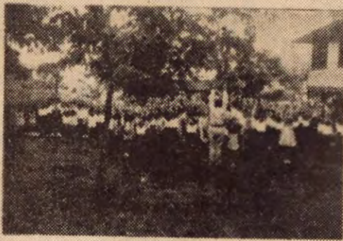
Los alumnos de la Escuela de Gollina hacen los ejercicios matutinos, dirigidos por uno de sus maestros.