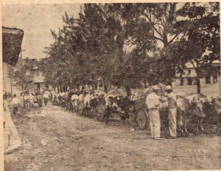
Día de Mercado de leña en la Plaza de la Iglesia en San Isidro del General

Así es de agradable, acogedor, interesante y bonito el Valle de El General.